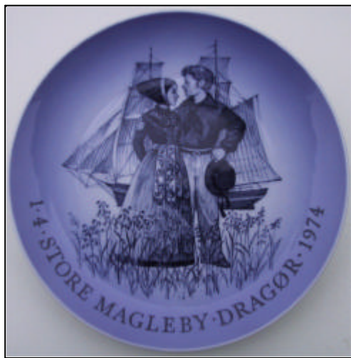
Porcelænsplatte fra kommunesammenlægningen. Tegningen er udført af Mads Stage.

med Biblioteket i Dragør, er alle velkommen til "Kommunesammenlægningen". Dette arrangement starter klokken 19.30. KM