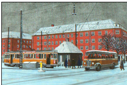
Sporvejshistorisk selskab er dem, der driver Sporvejsmuseet Skjoldnæsholm.