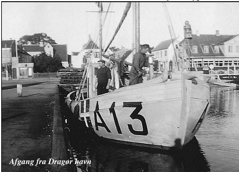
Afgang fra Dragør havn

Der er fortalt langt mindre om de store beløb, som mellemænd og fiskere krævede for at sejle de flygtende over vandet.