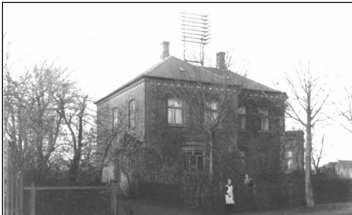
Foto fra 1917 af huset på Stationsvej. Bemærk telefonledningerne på taget.