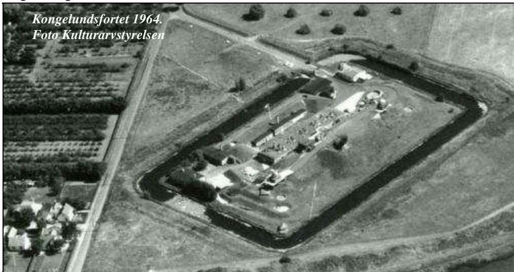
Kongelundsfortet 1964.

Kystartelleriforeningen vil stå for Dragør fort.